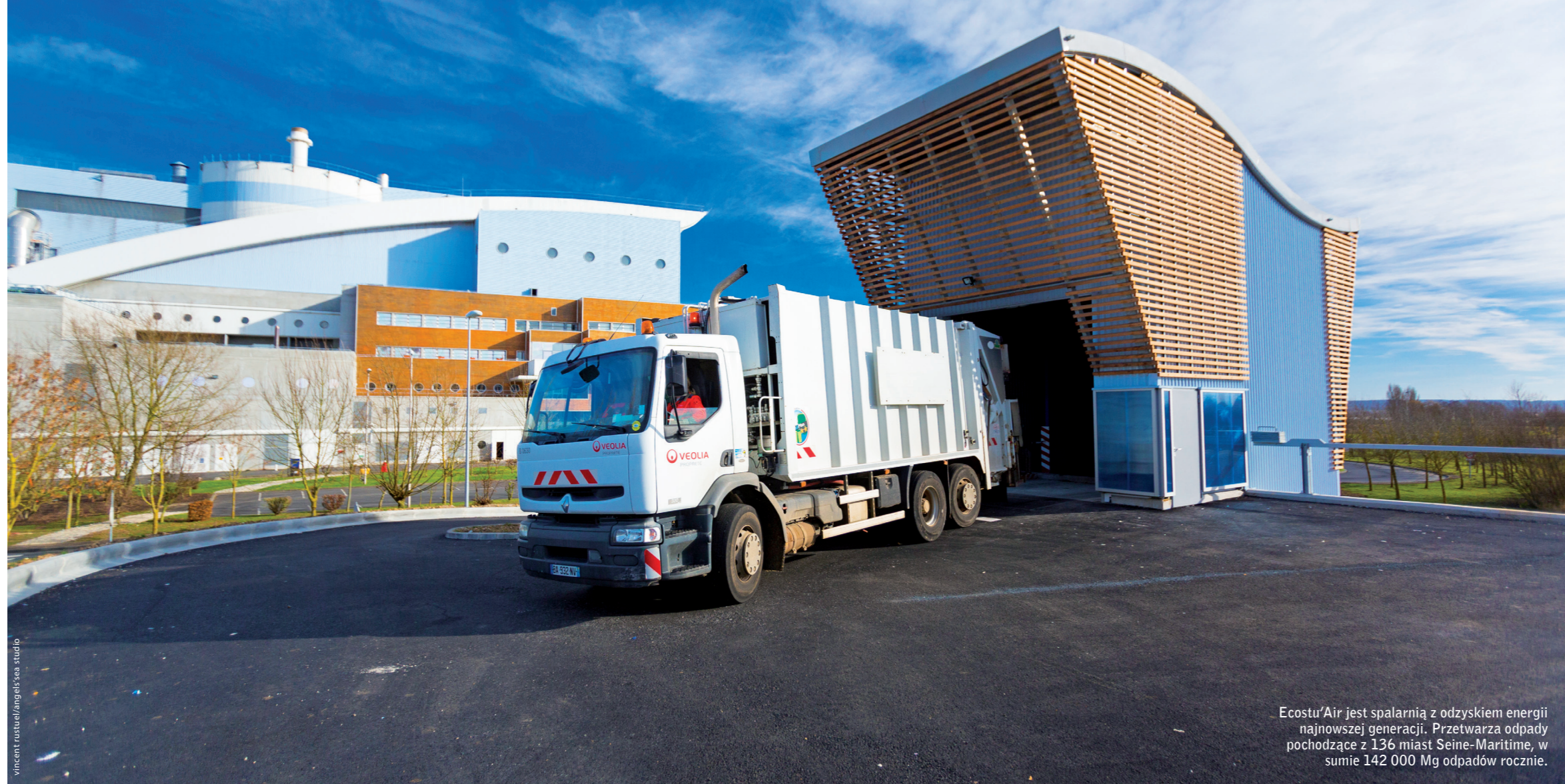
Ecocu'Air jest spalarnią z odzyskiem energii najnowszej generacji. Przetwarza odpady pochodzące z 136 miast Seine-Maritime, w sumie 142 000 Mg odpadów rocznie.

międzynarodowych przedsięwzięć jest wyższa niż 66% (wielkość udziałów Veolia w Dalkia). W innym projekcie, niemieckie przedsiębiorstwo energetyczne E.ON sfinalizowało transfer filii E.ON Energy z Waste AG (EEW) do EQT, szwedzkiego funduszu inwestycyjnego, który nabył ponad 51% udziałów. EEW dysponuje ok. 18% udziałów w niemieckim rynku spalania odpadów z 19 spalarniami (z których 13 należy do firmy), z łączną wydajnością przerobową 4,5 miliona Mg i odzyskiem energii na poziomie ok. 1 700 GWh energii elektrycznej i 2 400 GWh ciepła. W 2013 roku, EEW wygenerowało sprzedaż wartą 514 milionów (euro) i zatrudniło 1 300 pracowników. Biorąc pod uwagę nowe sfinalizowane inwestycje, brytyjska filia Suez Environnement SITA UK jest szczególnie aktywna na rynku brytyjskim. 8 października 2014 roku uruchomiła ona nowy zakład odzysku energii w Teesside. Kontrakt między konsorcjum prowadzonym przez partnerstwo SITA UK, South Tyne i Wear Waste obejmuje przetwarzanie 190 000 Mg/r odpadów komunalnych z gmin Gateshead, South Tyneside i Sunderlandu.