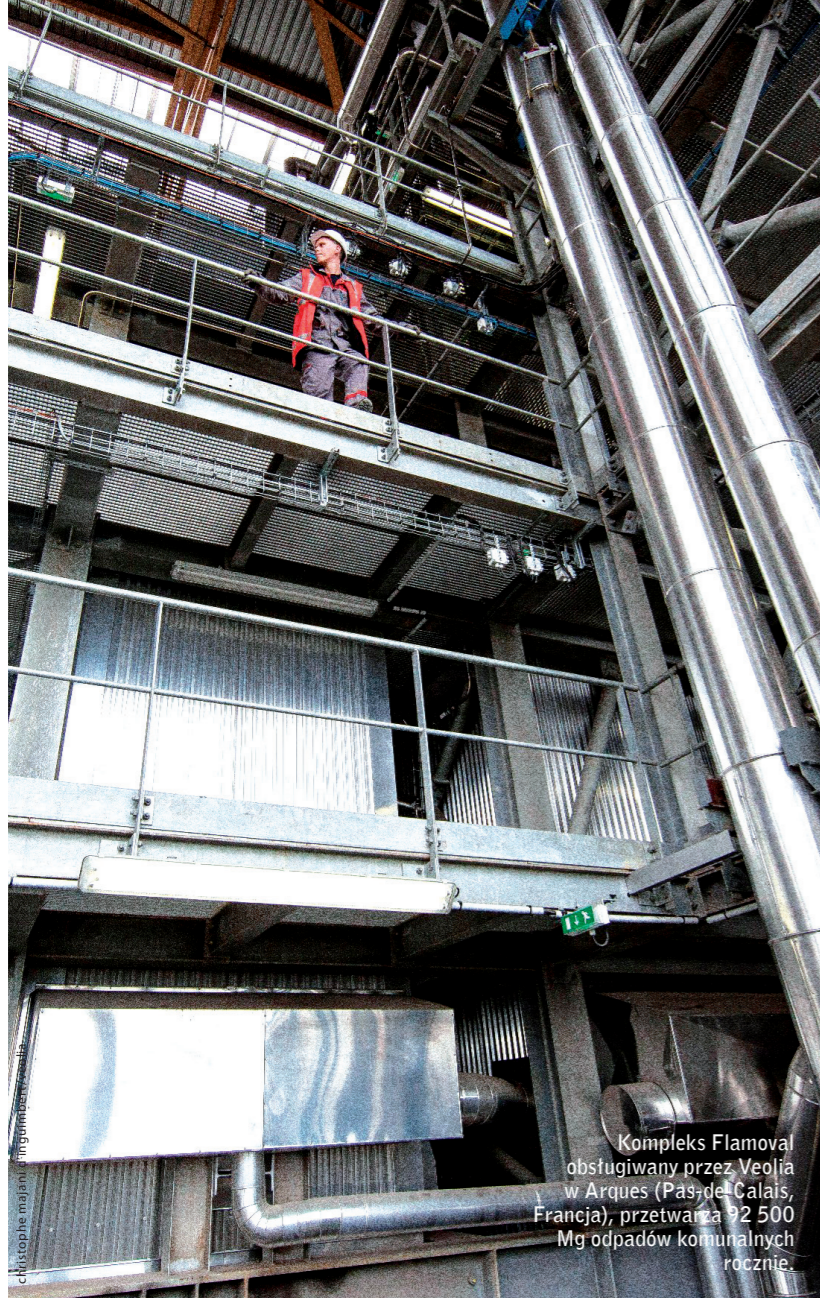
Kompleks Flamoval obsługiwany przez Veolia w Arques (Północ, Francja), przetwarza 92 500 Mg odpadów komunalnych rocznie.

Zgodnie z danymi konsorcjum EurObserv'ER, w 2013 roku ilość energii odzyskanej w procesie termicznego przekształcania biodegradowalnej frakcji odpadów komunalnych, do których zalicza się frakcje biodegradowalne odpadów zmieszanych (jak kartony, odpady kuchenne itd.), nieznacznie wzrosła (o 0,7%), do poziomu około 8,7 Mtoe (tabela 1). Sprzedaż ciepła sieciowego zwiększyła się wyraźnie w 2013 roku, głównie dzięki połączeniu integracji technologicznej spalarni odpadów a sieciami ciepłowniczymi. Produkcja ciepła od 2012 roku wzrosła o 7,8% i osiągnęła 2,4 Mtoe (tabela 3), podczas gdy wytwarzanie energii elektrycznej utrzymywało się na stabilnym poziomie 18,7 TWh (tabela 2). Pozytywnie na wzrost wykorzystania energii pierwotnej wpłynęła również poprawa efektywności energetycznej w spalarniach odpadów,